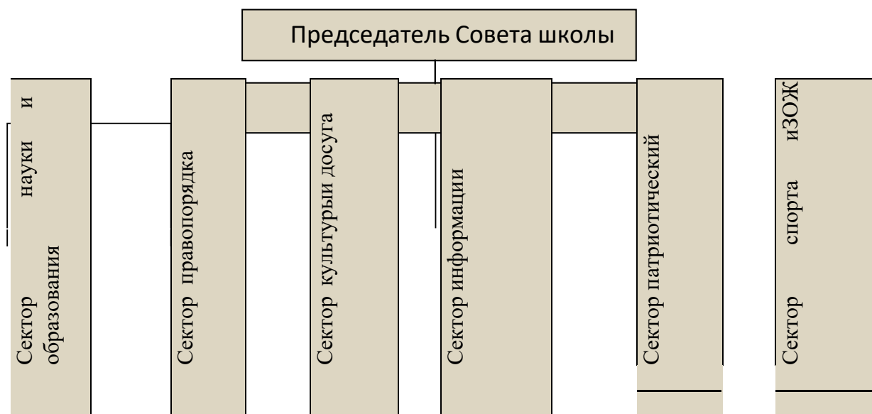
Деятельность самоуправления в МОУ Чердаклинской СШ №2: